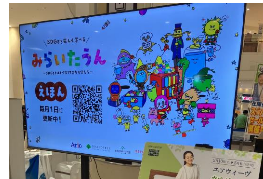
4 75インチ/横小型/非固定式