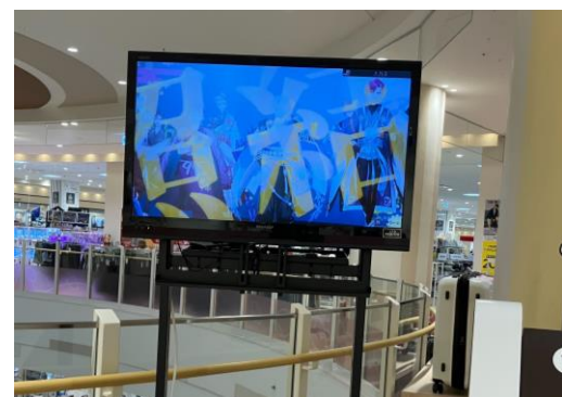
6 32インチ/横小型/非固定式