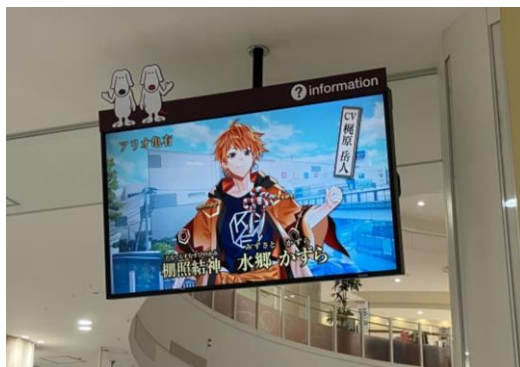
1 60インチ/横小型/固定式