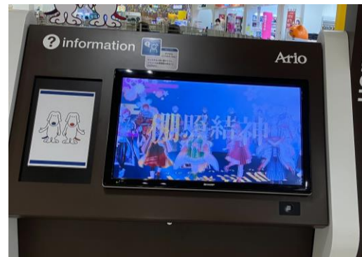
3 32インチ/横小型/固定式