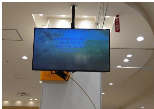
2 50インチ/横小型/固定式