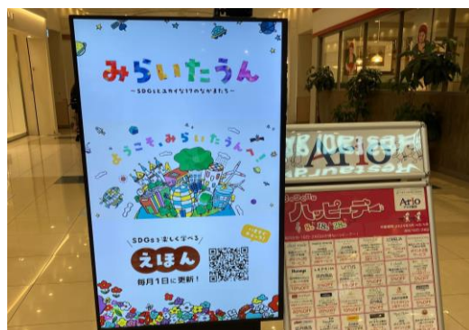
5 49インチ/縦小型/非固定式